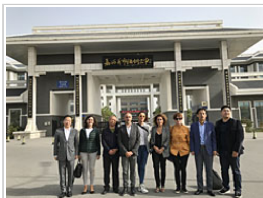
Ordezkaritza biak lanbide heziketa ikastetxeetan bisita egin ondoren.