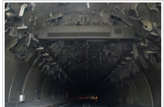
Bobedaren barruko estaldura, sutearen ondorioz askatu zena

Iragan uztailaren 8an Belateko tunelaren barruan kamioi batek su hartu ondoren instalazioan eragindako kalteak direla-eta, azpiegitura irailaren amaierara arte itxita egongo da. Hala erabaki du Nafarroako Gobernuak Sustapen eta Etxebizitza Departamentuko Kontserbazio Zerbitzuak. Zerbitzu horretan lanean eta gertaeraren garrantzia dela-eta behar diren kudeaketa lanak burutzen ari dira.