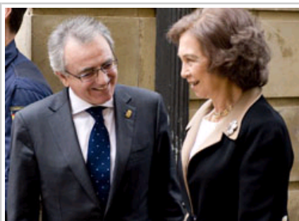
El Presidente Sanz saluda a Su Majestad