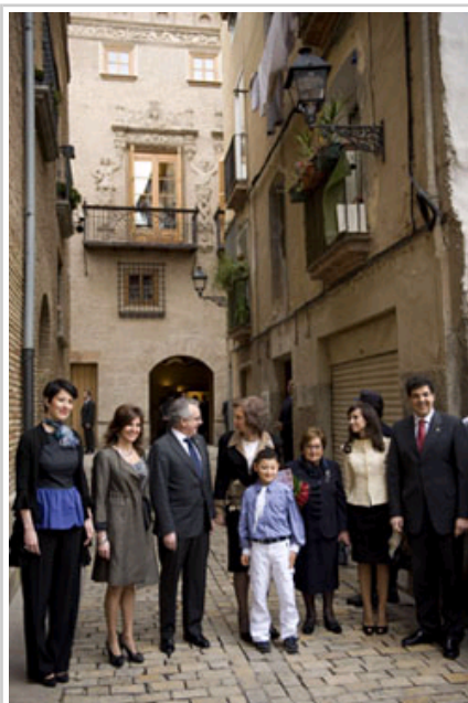
Ante la Casa del Almirante