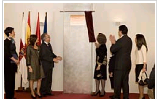
Su Majestad la Reina descubre la placa conmemorativa de la visita a la Casa del Almirante