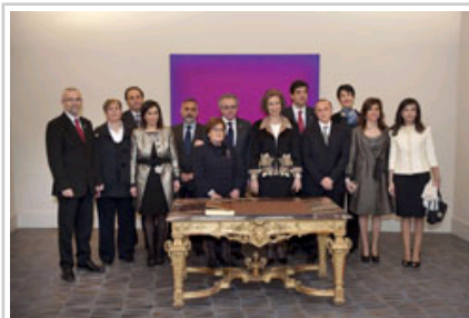
El patronato de la Fundación