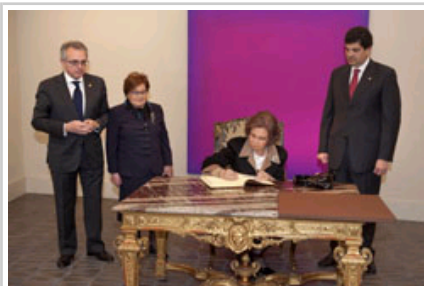
Firma libro honor Fundación