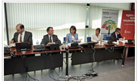
Barcina Lehendakaria Moderna Fundazioaren Patronatuko bilkuraren buru.

Orain arte Moderna Zigiluak lortu dituzten 113 proiektuek 1.600 lanpostu baino gehiago sortuko dituzte Nafarroako ekonomiaren garapenerako funtsezkoak diren sektoreetan. Hala azaldu da gaur Moderna Fundazioaren Patronatuko bilkuran; bilkura hori Nafarroako Unibertsitate Publikoan egin da Fundazioko lehendakaria eta Nafarroako Gobernuko Lehendakari Yolanda Barcina buru direla.