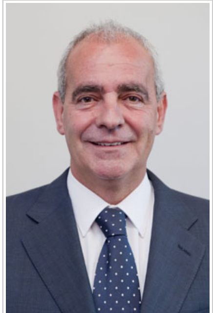
Jesús Pejenaute Grávalos, consejero de Políticas Sociales.