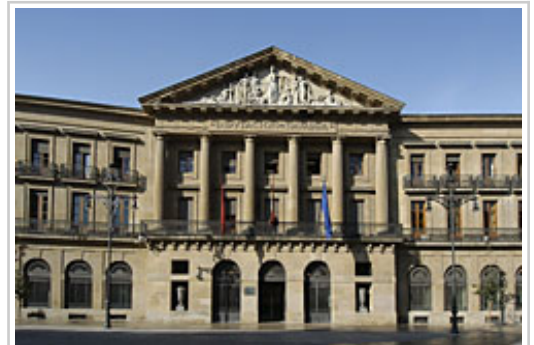
Fachada del Palacio de Navarra.