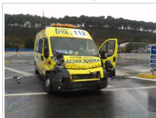
La ambulancia implicada en el accidente.

SOS Navarra ha movilizado, además de a los bomberos, las ambulancias que se han encargado del traslado tanto de