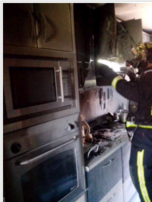
Un bombero en la cocina incendiada en la calle Padre Adoain.

Además, se ha registrado otro incendio en un domicilio de la plaza de Los Burgos, de Pamplona, sin que se produjeran heridos ni intoxicados. El fuego se ha producido a las 10.47 horas en la cocina y ha afectado al extractor. Bomberos del parque de Pamplona, con apoyo del camión escala del parque Central, han finalizado las labores de extinción a las 11.10 horas. La ambulancia que había sido enviada preventivamente no ha tenido que intervenir. La Policía Municipal ha vigilado la zona e instruye las diligencias del suceso.