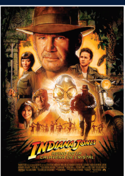
INDIANA JONES Y EL REINO DE LA CALAVERA DE CRISTAL