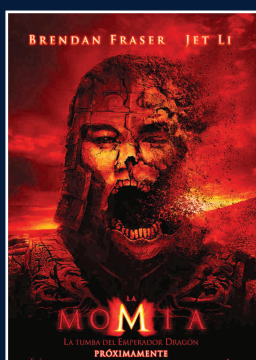
LA MOMIA, LA TUMBA DEL EMPERADOR DRAGÓN

Reparto Robert Downey Jr. Terrence Howard Jeff Bridges Shaun Toub Gwyneth Paltrow Faran Tahir Jon Favreau