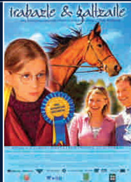
IRABAZLE & GALTZAILE