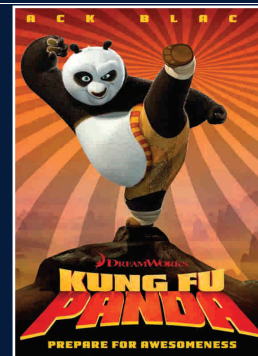
KUNG FU PANDA

Reparto Brendan Fraser Jet Li María Bello Luke Ford John Hannah Michelle Yeoh Isabella Leong