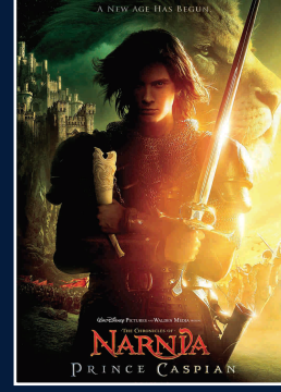
LAS CRÓNICAS DE NARNIA, EL PRÍNCIPE CASPIAN

Reparto Meryl Streep Pierce Brosnan Colin Firth Amanda Seyfried Julie Walters Stellan Skarsgard Christine Baranski