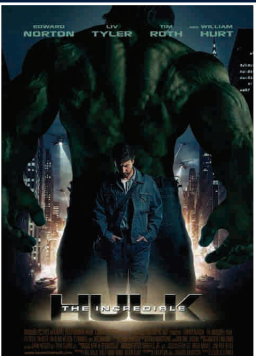
EL INCREÍBLE HULK