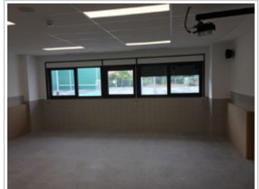
J. Lizarraga IPen sortutako ikasgela berrietako bat.

Gaurko egunez, lehenengo faseari, hots Joakin Lizarraga Ikastetxe Publikoko handitze lanei dagozkien lanen harrera partziala egin da eta hortaz, 2018/2019 ikasturtearen hasieratik erabilgarri daude hiru gela berriak.