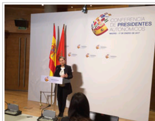
La Presidenta Barkos, durante su rueda de prensa.

Esta VI Conferencia se produce cuatro años después de la última, celebrada en octubre de 2012. La Conferencia de Presidentes es el máximo órgano de cooperación política entre el gobierno de España y los gobiernos de las comunidades autónomas y las ciudades de Ceuta y Melilla.