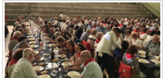
El frontón ha acogido la comida popular.