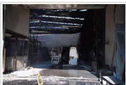
El fuego ha calcinado dos vehículos.