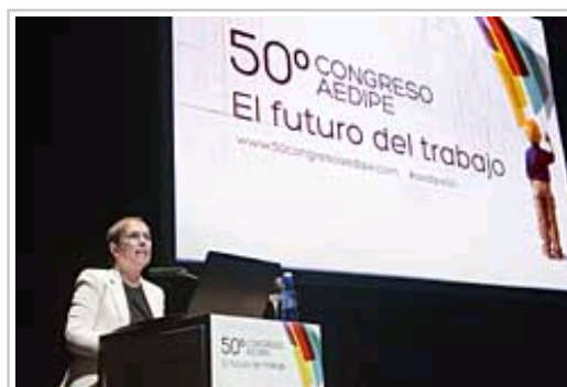
La Presidenta Barkos interviene ante el congreso de AEDIPE.

La Presidenta de Navarra, Uxue Barkos, ha inaugurado esta mañana el congreso de AEDIPE (Asociación Española de Dirección y Desarrollo de Personas) “El futuro del trabajo”, donde ha afirmado que una clave para asegurar el crecimiento económico de una región es su capital humano. “Precisamente por esto –ha dicho-, este congreso es ciertamente interesante, ya que se van a abordar estas cuestiones tan importantes para el futuro de nuestras sociedades. Es el foro perfecto para compartir reflexiones, conocimientos y experiencias, además de generar ideas y formular propuestas”.