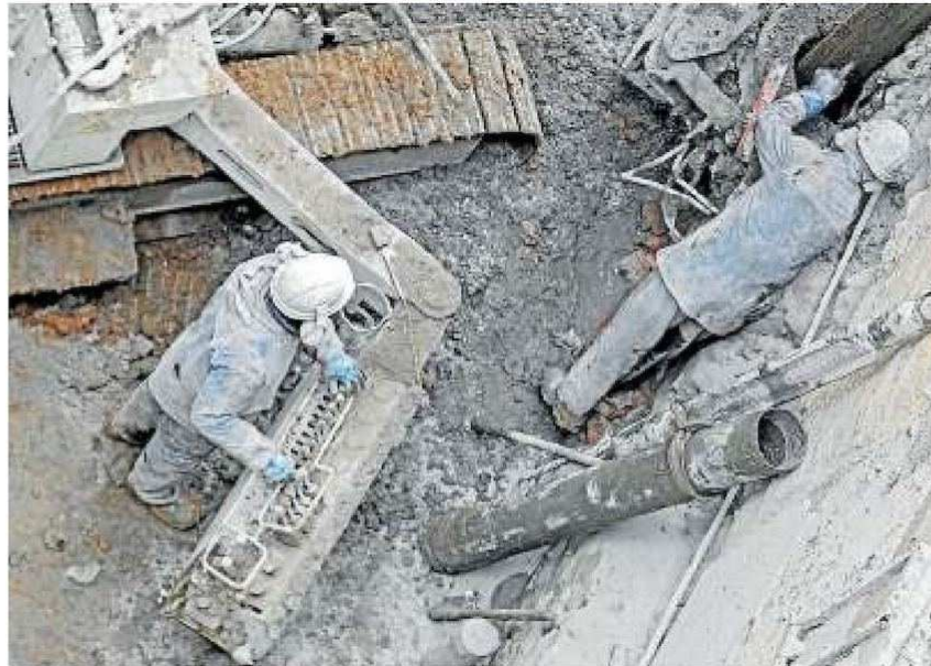
La construcción es el sector en el que más crecen los accidentes.

Los accidentes crecen prácticamente en todas las actividades económicas, pero aumentan con especial intensidad en la construcción, precisamente una de las actividades que menos se ha beneficiado de la recuperación económica de los dos últimos años. La siniestralidad avanza un 19,82%, más rápido que en el