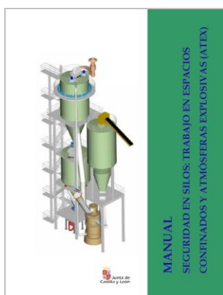
Manual de seguridad en silos: trabajo en espacios confinados y atmósferas explosivas