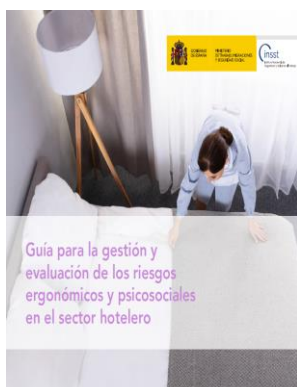
Guía para la gestión y evaluación de los riesgos ergonómicos y psicosociales en el sector hotelero