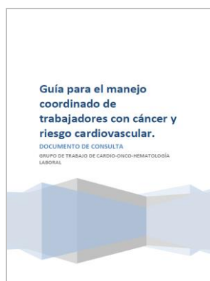
Guía para el manejo coordinado de trabajadores con cáncer y riesgo cardiovascular