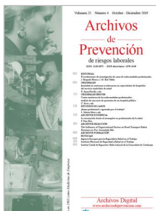
Archivos de prevención. Vol. 22, Núm. 4, octubre-diciembre 2019