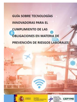
Guía sobre tecnologías innovadoras para el cumplimiento de las obligaciones en materia de prevención de riesgos laborales

Nafarroako Osasun Publikoaren eta Lan Osasunaren Institutuak (NOPLOI) ez du bere gain hartzen argitaraturiko artikuluen eta albisteen edukirik; izan ere, bere horretan hartu dira kasuan-kasuan aipaturiko webgunetik, iturria aipatuz, eta ez zaie aldaketarik egin ezta ezer erantsi ere. Edozein kontsulta edo iradokizun egiteko, edo bidaltzaile honen informaziorik ez baduzu jaso nahi aurrerantzean, jar zaitetz harremanetan NOPLOIrekin, helbide elektronikoa honetara idatziz: bibliotecainsl@navarra.es