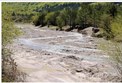
Ezka eta Binies ibaiak