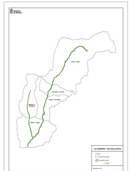
Ezka eta Binies ibaietako zainketa bereziko eremuaren planoak