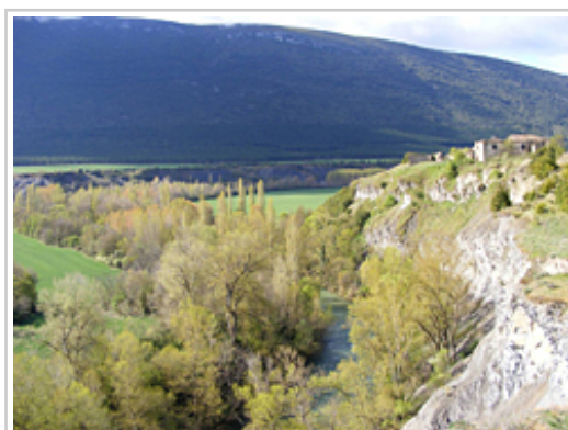
Igaraba edo bisoi europarra dira Zaraitzu ibaiko espezie aipagarrienetako bi

Ia ibai osoan zeharreko bi ibaiertzeko landaredia nabarmentzen da eremuan. Pirinioetako ibaiertzeko hainbat baso eta baso aurreko motaren adibide adierazgarriak ditu. Gainera, Europar Batasunaren intereseko beste habitat batzuk ere baditu eremuak, ugaldeen bereizgarri direnak, esate baterako, hondartzetako eta legar-harteetako landareak eta larre eta