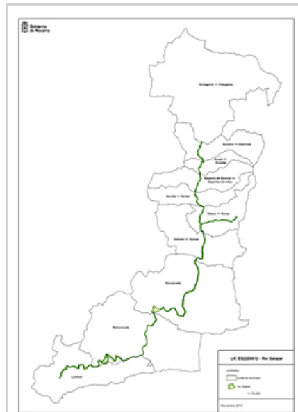
Zaraitzu ibaiko zainketa bereziko eremuaren planoak