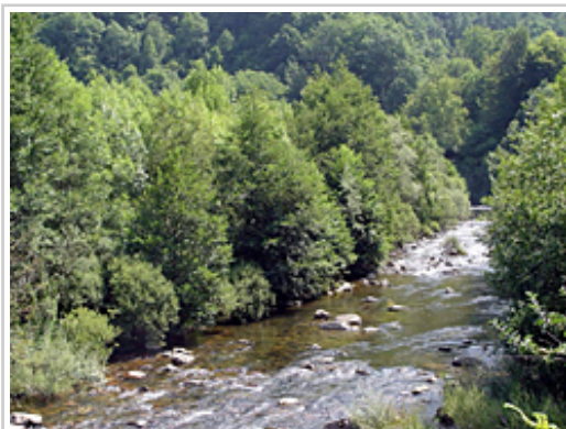
Irati, Urrobi eta Erro ugaldeen sisteman, Europar Batasunaren intereseko zazpi habitat mota daude

Irati, Urrobi eta Erro ibaien hainbat tarte sartzten dira eremuan, baita Txangoa errekaen zati bat ere. Irati ibaiaren bi tarte sartzten dira eremuan, Itoizko urtegiak eteten dituenak; haietako lehena Txangoa errekaekin bat egiten duen puntuan hasten da, eta Orotz-Betelutik behera bukatzen da; bigarrena, berriz, Itoizko urtegitik (Agoitz) Aragoi ibaiarekin bat egin arteko tarte da. Urrobi ibaiaren tarte Alorzar inguruan (Orreaga) hasten da eta Itoizko urtegiaren iparraldeko aldean bukatu, Nagoretik gertu. Erro ibaiaren zatia Iruizan hasi eta Irati ibaira isurtzen den tokian amaitzen da. Azkenik, Txangoa errekaen kasuan, Orbaizetako Fabrikatik Irati ibaira isuri arteko tarte sartzten da eremuan.