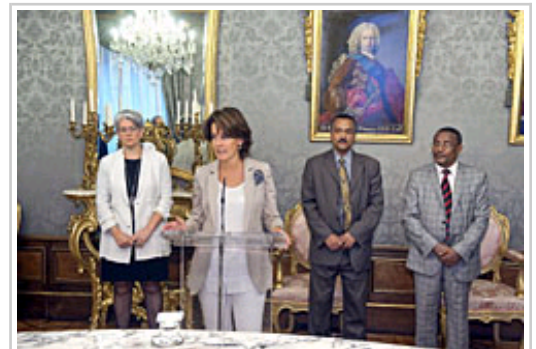
Barcina Lehendakaria Etiopiako ordezkari-tzako kideei hitz egiten.

Ildo horretatik, Etiopiako ministroak adierazi du bere Gobernua gogor ari dela lanean herrialdea garatzeko asmoz. Hark baieztatu duenez, helburua Etiopia 10 edo 15 urtetan Afrikako ekonomia boteretsuenetako bat bihurtzea da. Horretarako, herrialde afrikarrak bere garapen ekonomikoa azkarra izatea bilatzen duen hazkunde eta eraldatzeko plan bat abian jarri du. Gerbak