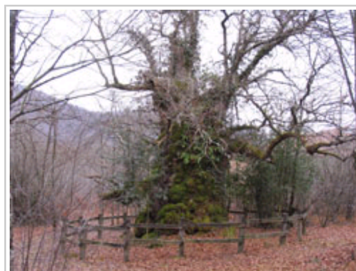
Roble de Jaunsarats.

Las personas interesadas en obtener más información o inscribirse en las actividades del programa, todas gratuitas, pueden llamar al teléfono 848 42 61 26, en horario de 10 a 14 horas, o dirigirse a las direcciones de correo electrónico participacion.ambiental@navarra.es o ingurune.partaidetza@navarra.es . Se debe facilitar el nombre de las personas que deseen participar y un número de teléfono o mail de