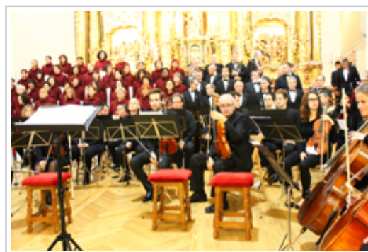
Iruñeko Orfeoia eta Sinfonietta Académica.

Deialdiak aurrekontua bi mailatan banatzen du: 45.000 eurotik gorako proiektuak, eta zifra horren azpitik daudenak. Lehengoetarako 1.134.000 € daude, eta bigarrengoetarako, 126.000 €.