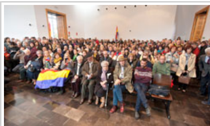
Publikoa lokalak bete ditu.