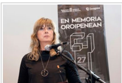
Ollo aholkularia, bere hitzaldian zehar.