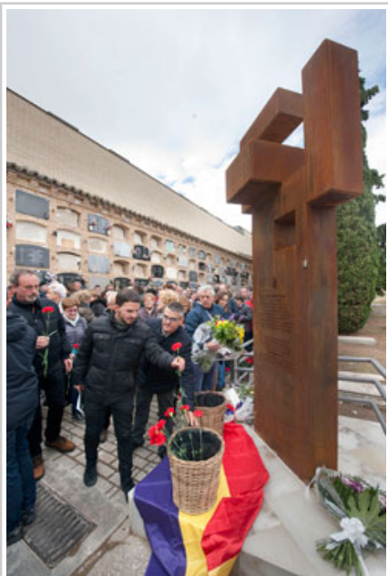
Lore eskaintza monolitoaren aurrean.