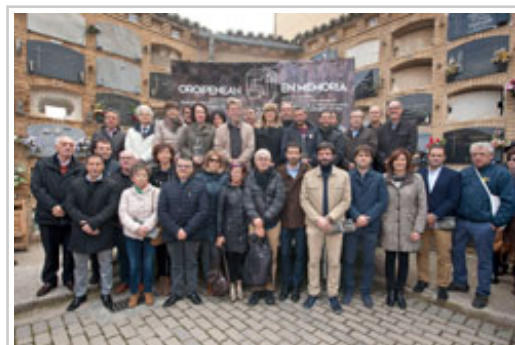
Autoritateak eta gonbidatuak, Torrero hilerrian.

aldarrikatzeko egin duten lanagatik eta bizikidetzarako bidea erakustean frogatu duten eskuzabaltasunagatik, "ezinikusi eta gogorrotik gabe, gertatutakoaren memoria erreklamatzeko eta basakeriak eragindako bidegabekeriaren eta atsekabearen iraganeko oroimena aldarrikatuz, bakearen, askatasunaren, demokraziaren eta Giza Eskubideen alde hartu dugun egungo konpromisoa finkatu eta indartzeko", gaineratu du.