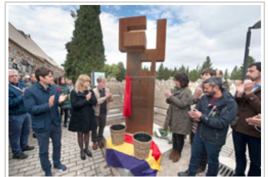
Olo aholkularia eta beste agintariek txalo egiten dute monolitoaren inaugurazioa egin ondoren.

. Orduko ahalegina, kontseilariaren iritziz, "giltzarritzakoa izan zen memoria, egia eta justiziaren erreibindikazioan, eta urte gehiegiz sostengu instituzionalik gabe egindako bide luze, gogor eta nekezaren buruan, gaurkoa bezalako ekitaldiak egiteko aukera dugu egun".