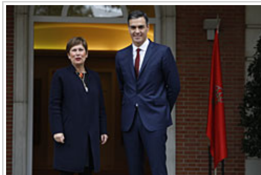
Sánchez recibe a la Presidenta de Navarra.

Finalmente, la Presidenta de Navarra, que se ha mostrado “satisfecha” por el desarrollo del encuentro con Pedro Sánchez y los acuerdos alcanzados en materia de transferencias y actualización legal del Convenio Económico, se ha referido a un tercer acuerdo “que podremos alcanzar porque los equipos técnicos siguen trabajando”, la negociación para dar cumplimiento a las inversiones financieramente sostenibles por importe de 113 millones que el Parlamento de Navarra acordó recientemente mediante ley foral. Barkos ha explicado que le ha trasladado al Presidente Sánchez que Navarra “será enormemente ambiciosa” en una lectura no restrictiva de la Ley de Estabilidad Presupuestaria de 2012 para poder alcanzar la ejecución global planteada desde Navarra y financiada desde su superávit presupuestario.