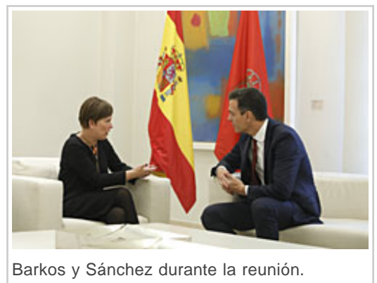
Barkos y Sánchez durante la reunión.

La Presidenta de Navarra, Uxue Barkos, y el Presidente del Gobierno de España, Pedro Sánchez, han acordado en su primer encuentro institucional que han mantenido este mediodía en el Palacio de la Moncloa acometer “de forma definitiva” la transferencia de Tráfico y Seguridad Vial a la Comunidad Foral, así como acelerar la reforma de la Ley del Convenio Económico Navarra-Estado, con el objeto de que entre en vigor con carácter previo a la negociación de la Aportación correspondiente al quinquenio 2020 – 2024.