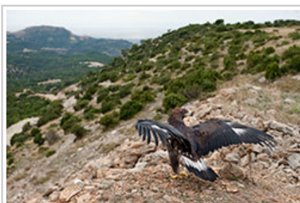
El águila despliega las alas tras ser liberada