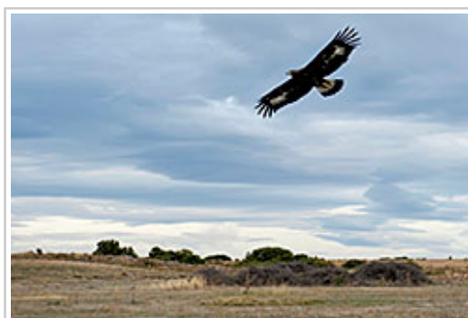
Primer vuelo del águila real tras su liberación en las Bardenas Reales.

El águila, una vez en el centro de recuperación, estuvo en tratamiento hasta recuperar las condiciones físicas adecuadas y, posteriormente, pasó a un gran voladero de forma elíptica donde se fortaleció y aprendió a cazar. Pasada esta fase, se ha considerado que el ave está ya preparada para recuperar la libertad y reintegrarse de