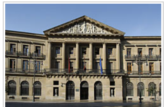
Nafarroako Jauregiko fatxada.