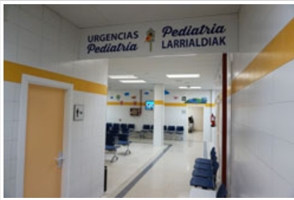
San Martingo larrialdi pediatriko berrietarako sarbidea.