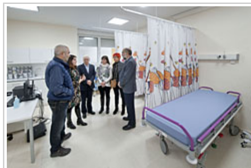
Instalazio berriak bisitatzen

Laugarren solairuko gune berriak 11 gela ditu: lau Anestesia-kontsultetarako (Erizaintzako bi eta Medikuntzako bi), beste lau Otorrinolaringologiarako, miatzeen gela bat, eta audiometriak egiteko bi gela. Solairu horretan, beste itxarongela bat ere gaitu da, laborategi-atalaren ondoan, glukosa-frogak egiten