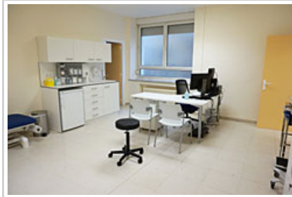
Larrialdi berriek izango dituzten gela berrietako bat.