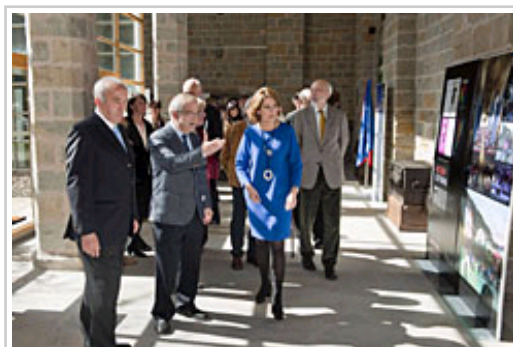
La Presidenta Barcina visita la exposición itinerante del 75º aniversario de la Institución Príncipe de Viana.

entre otros, la recuperación de los esmaltes del retablo de San Miguel de Aralar, las excavaciones del poblado del Alto de la Cruz, en Cortes, así como el primer Catálogo Monumental de Navarra. La muestra ha sido organizada por la Dirección General de Cultura.