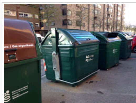
Contenedores para la recogida de residuos en una calle de Pamplona.

El próximo lunes, día 4 de abril, comienzan en Lumbier las reuniones del proceso de información y participación pública del Plan Integrado de Gestión de Residuos de Navarra (PIGRN). La reunión va dirigida a la población de los Valles Pirenaicos y de la Comarca de Sangüesa, en concreto a las que pertenecen a las Mancomunidades de Bidausi, Irati, Esca-Salazar y Sangüesa. A este foro le seguirán otros en Doneztebe-Santesteban, Irurtzun, Olite, Estella-Lizarra, Pamplona y Tudela, en los que se discutirán alternativas y se buscarán consensos que conduzcan a la redacción del plan definitivo antes de finalizar el verano.