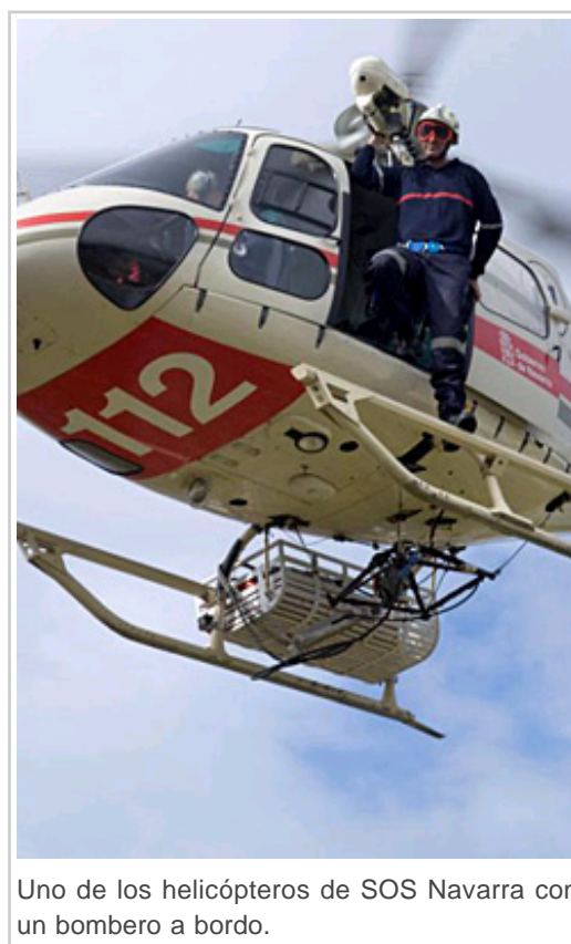
Uno de los helicópteros de SOS Navarra con un bombero a bordo.

Entre los recursos y el personal movilizados con mayor frecuencia para atender estas emergencias destacan los equipos sanitarios de atención primaria (que fueron necesarios en 105.617 intervenciones), las