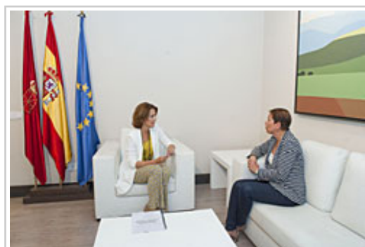
Yolanda Barcina y Uxue Barkos han mantenido una reunión para el traspaso de poderes.

Tras la reunión, ambas han mantenido un encuentro con los medios de comunicación en el que Yolanda Barcina ha señalado su total disposición a que el traspaso de poderes se realice con total normalidad y transparencia, a la vez que ha reiterado su total disposición y la de los consejeros en funciones para que la nueva Presidenta pueda comenzar con la máxima rapidez a gestionar la