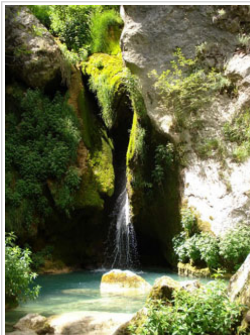
Fotografía ganadora en facebook.