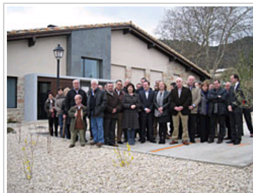
Kutz kontseilaria, udaleko agintariak, osasun langileak eta Mendazako biztanleak kontsultategi berriaren ondoan

Kontsultategiko instalazioen azalera osoa 138 metro koadro eraiki da eta mediku orokorraren kontsulta gela bat, erizaindegi bat, itxaron gela bat, komunak eta biltegia ditu. Mendazako kontsultategia Lizarrako Osasun Barrutiko Antzin-Ameskoa Oinarrizko Osasun Barrutira atxikita dago. 508 osasun txarten ditu esleituta eta mediku orokor batek eta erizain batek eskaintzen dute arreta.