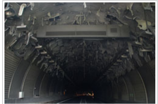
El revestimiento interior de la bóveda, desprendido a causa del incendio.

Los daños en las instalaciones ocasionados por el incendio de un camión en el interior del túnel de Belate el pasado 8 de julio obligan a mantener cerrada esta infraestructura hasta finales de septiembre. Así lo ha estimado el Servicio de Conservación del Departamento de Fomento y Vivienda del Gobierno de Navarra, desde donde se está trabajando y realizando las gestiones oportunas que el alcance de esta incidencia están requiriendo.