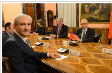
El vicepresidente Ayerdi y el consejero Aranburu, frente al ministro Montoro.