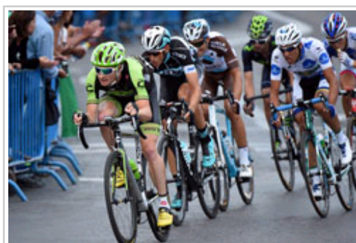
Imagen de la edición 2015 de La Vuelta.

La localidad navarra de Urdax protagonizará dos de las principales etapas de La Vuelta 2016 , en concreto la más larga ( Bilbao-Urdax , de 212 kilómetros) y la salida de la etapa reina ( Urdax-Gourette , de 195,6 km), que se celebrarán respectivamente los días 2 (viernes) y 3 (sábado) de septiembre.