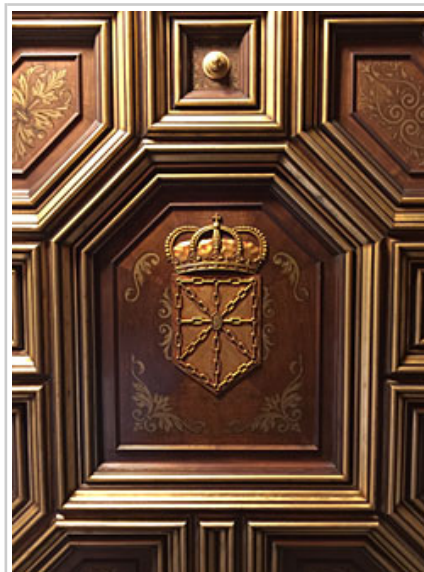
Detalle del escudo, tras la restauración.