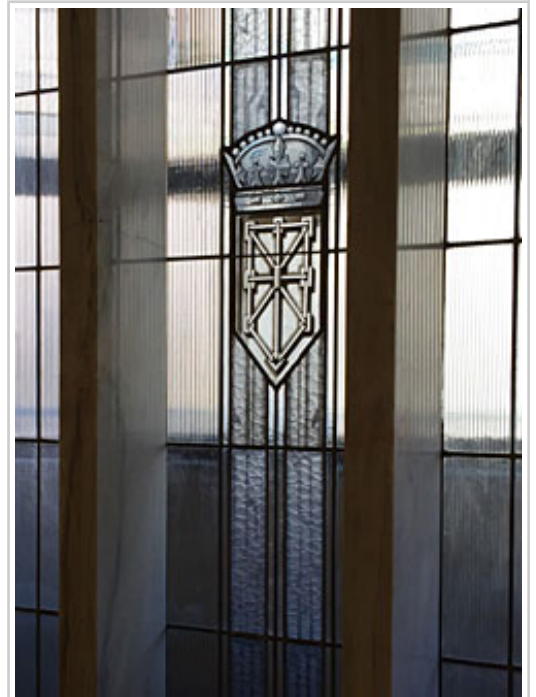
Ogasuneko eraikinaren beiratea, egokitze-lanak egin eta gero

Artisau beiragile batek Ogasuneko Eraikinaren leiho batean dagoen beiratean aldaketak egin eta gurutzearen piezak aldatu dizkio. Bestalde, zaharberitze-lanetan espezializatuta dagoen enpresa batek Bilera Aretoko izkina bakoitza dekoratzen zuten armarriez aparte jarrita zegoen gurutzearen egurrezko piezak kendu ditu, eta kasetoiduraren pusketa horiek zaharberitu ditu. Foru Gobernua asteazkenero biltzen da Bilera Areto horretan, asteroko bilera egiteko.