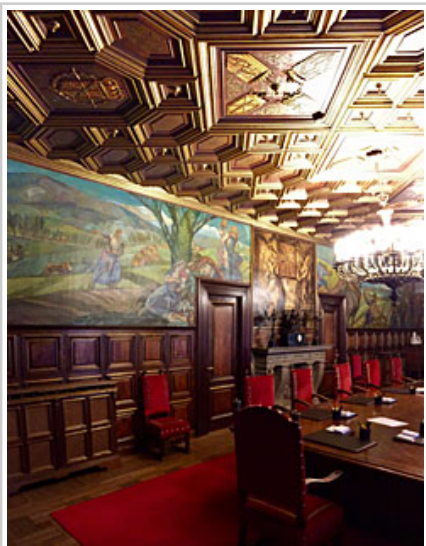
Salón de Sesiones, antes de la adecuación del escudo.