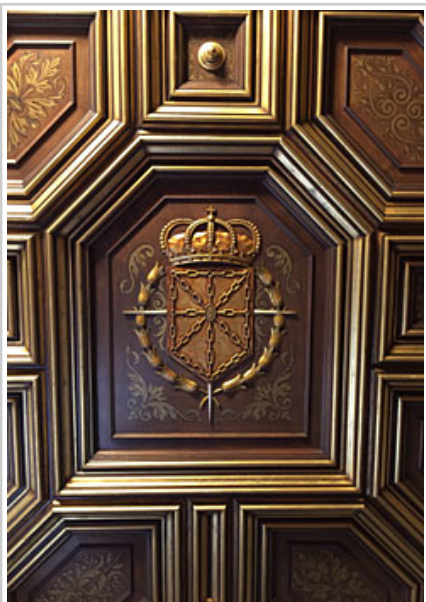
Detalle del escudo del Salón de Sesiones, antes de su restauración.