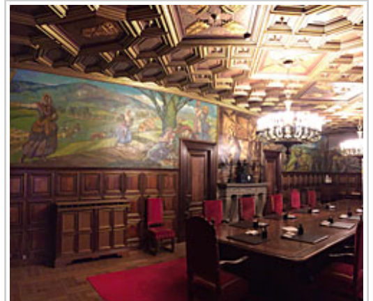
Gobernuaren Bilera Aretoa, armarrira arautegira egokitu eta gero.

Nafarroako Gobernuak erregimen frankistaren sinboloak kendu eta ordeztu ditu, memoriari buruzko politika publikoekin aurrera egin eta Sinboloei eta Memoria Historikoari buruzko Foru Legeak betetze aldera. Nafarroako Gobernuak, Nafarroako Udalerri eta Kontzejuen Federazioarekin eta tokiko hainbat erakunderekin batera, programa bat abiarazi zuen 2016an, espazio publikoa demokratizatzeko eta indarkeria gogoratzen eta goraiatzeko duten sinboloak kentzeko helburuarekin.