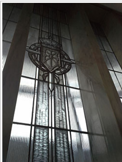
Vidriera de Hacienda, antes de los trabajos de retirada de la Cruz y Laureada.