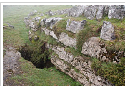
Sima de Oneta, en Aralar.