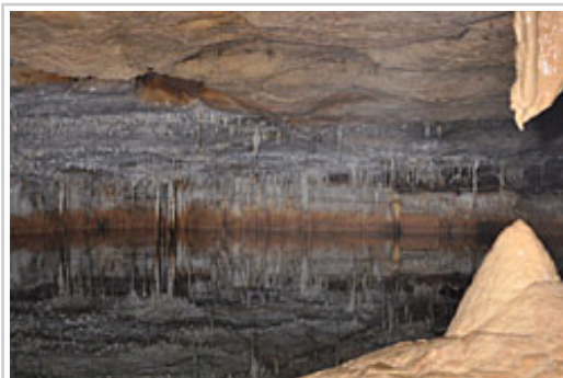
Interior de la cueva de Akoandi.

Una vez localizado un manantial, se situaba en campo en lo que se denominaba un “litoval” que era una copia en amoníaco en blanco y negro del negativo de las fotografías aéreas a escala 1/5.000 que representaba fielmente la fisonomía del territorio. Posteriormente, se procedía a su aforo y se rellenaba una ficha en la que se incluían todos los datos, y, si el caudal era de cierta importancia, se tomaba una muestra para su análisis. Cuando se entregaban los datos en las dependencias del entonces Servicio Geológico de Navarra se procedía por parte del personal cualificado a su situación en la cartografía y a la asignación de las correspondientes coordenadas, que debían calcularse en cada caso, ya que entonces no se disponía de los medios actuales ni de GPS. Posteriormente, se valoraba en cada caso si los manantiales tenían suficiente interés para mantener un seguimiento de sus aportaciones estacionales y su calidad.