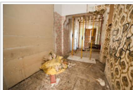
Ha sido necesario apuntalar muchas de las estancias.