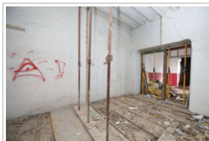
Espacio con el pavimento levantado.