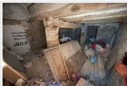
Obrako materialaren metaketa, aretoetako batean.

Txosten teknika behin-behinekoa da, eta luze gabe behin-betiko agiria taxutuko da, eraikinera egin beharreko azken bisitaren ondoren.