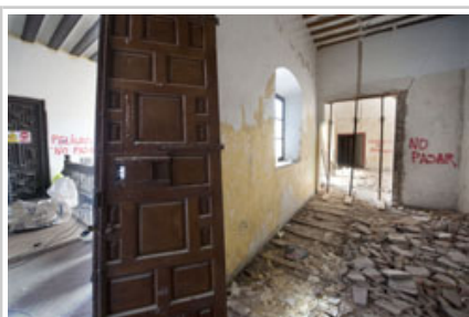
Se ha procedido a la señalización de los riesgos estructurales del edificio.