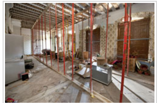
Eraikinaren barneko areto baten irudia.

Nafarroako Gobernuak Rozalejoko Markesaren Jauregia ixtea erabaki du segurtasunerako arrisku larriagatik. Erabakia Ondare Zerbitzuak egindako behin-behineko txosten teknikoa ezagutu ondoren hartu da, izan ere, agiri horren arabera, Rozalejoko Markesaren Jauregia erabiltzea arris arriskutsua da pertsonentzat.