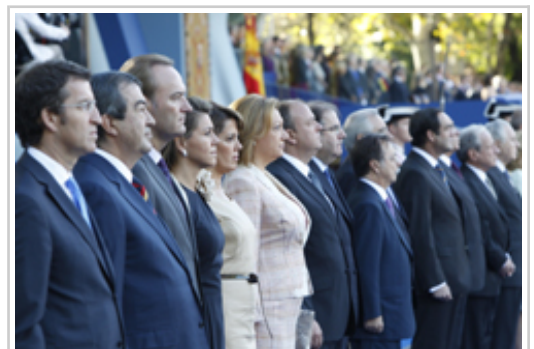
La Presidenta Barcina, junto al resto de presidentas y presidentes autonómicos.

El acto central del Día de la Fiesta Nacional ha consistido en un acto de homenaje a la Bandera Nacional, que se ha celebrado en la Plaza de Neptuno e Madrid, junto con un desfile militar entre la Plaza del Emperador Carlos V y la Plaza de Colón, en el que han participado más de 3.000 efectivos, 147 vehículos y 55 aeronaves de las Fuerzas Armadas.