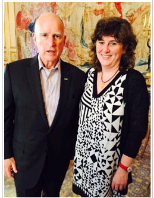
Eva García, con el gobernador de California, Jerry Brown.

Estos gobiernos regionales ofrecen un modelo de cooperación internacional más amplio, que se llevará a cabo en los ámbitos de su competencia, centrado en los ámbitos de eficiencia energética; tráfico y transporte; protección de los recursos naturales y reducción de los residuos; ciencia y tecnología; comunicación y participación pública; y contaminantes climáticos efímeros.