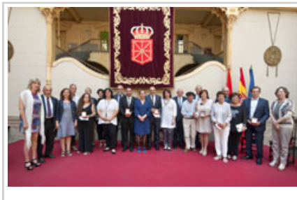
La Presidenta y los miembros del Gobierno, con los premiados.