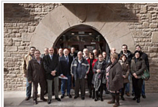
Zarraluqui kontseilaria Tafallako ORVEN sartuta dauden udalerrietako zinegotziekin.

Etxebizitzak eta Eraikinak Birgaitzeko Bulegoak, alde batetik, administrazioarekin dauden kudeaketetan hurbiltasun nahiz arintasun handiagoa dakarren tresna dira; eta bestetik, arlo horretan herritarrari arreta errazten diote, eraikinak birgaitzeko arloan toki-erakundeen eta Nafarroako Gobernuaren arteko lankidetzak handiagoa izanik. Aldi berean, eskualdeko identitatea sendotzen da eta hura osatzen duen udalerrri bakoitzarena. Abantaila gehigarri modura, ORVERi esker, bizitoki-ondareari buruzko benetako kontrola egin daiteke, eta partikularrek nahiz Nafarroako Gobernuak Etxebizitza Zerbitzuaren bidez burutzen duten birgaitzean egindako inbertsioei buruzko jarraipena egin daiteke. Alde ekonomikoan, tokiko jarduera ekonomikoa errazten dute hornitzaileekin eta baita hurbileko esku-lana ere. Bizigarritasun-ikuspegitik, narriatutako hiriguneen errekupeazioa errazten dute, hiri-kalitatea, bizi-kalitatea eta auzotasuneko itxaropenak hobetuz.