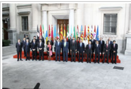
Foto de familia en la apertura de la V Conferencia de Presidentes de las Comunidades Autónomas.