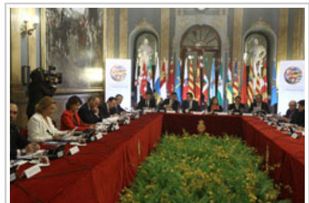
Vista general del inicio de la primera sesión de la Conferencia de Presidentes de Comunidades Autónomas.