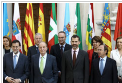
S. M. el Rey y SAR don Felipe de Borbón, en la imagen previa al inicio de la Conferencia de Presidentes de las Comunidades Autónomas.