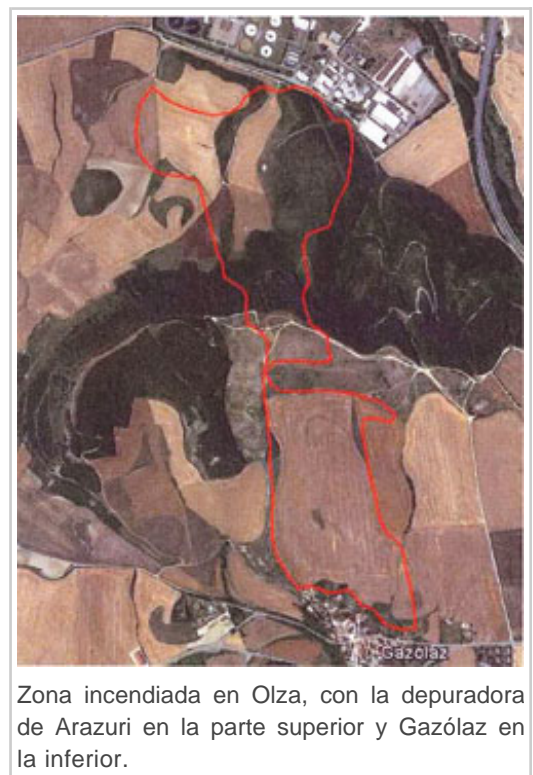
Zona incendiada en Olza, con la depuradora de Arazuri en la parte superior y Gazólaz en la inferior.

El más extenso fue el fuego de Galar, que tuvo su origen en el término de Barbatáin. Ardieron 95 hectáreas, 93 de ellas de superficie agrícola que incluyen cereal cosechado y sin cosechar, y 2 de arbolado (pino Alepo). En el incendio de Arazuri, en la Cendea de Olza, el fuego calcinó 54 hectáreas de las que 18 eran terrenos forestales. Se quemaron 13 hectáreas de pino laricio y 5 de pasto y matorral, y las 36 restantes eran campos de cultivo. El informe resalta que el fuego se aproximó hasta las primeras casas de Gazólaz y que los habitantes de la localidad fueron desalojados preventivamente.