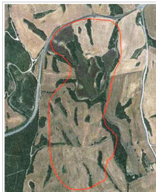
Foto del área afectada en Añorbe.

El Gobierno de Navarra insiste en su llamamiento a la población para que extreme las precauciones y evite cualquier práctica que pudiera suponer riesgo de incendio .