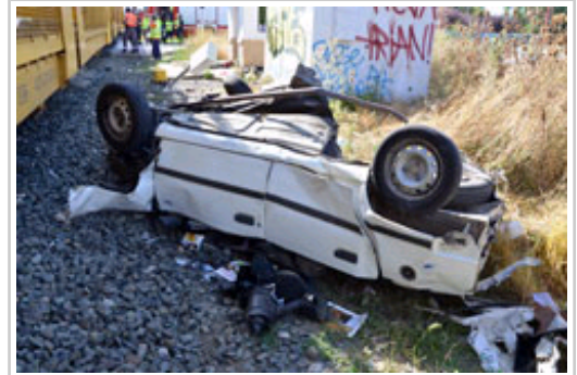
El turismo accidentado.

consejero ha añadido que la supresión definitiva del de Berriozar se producirá en el momento en el que se habilite el trazado ferroviario que dará servicio a la nueva estación de Pamplona.