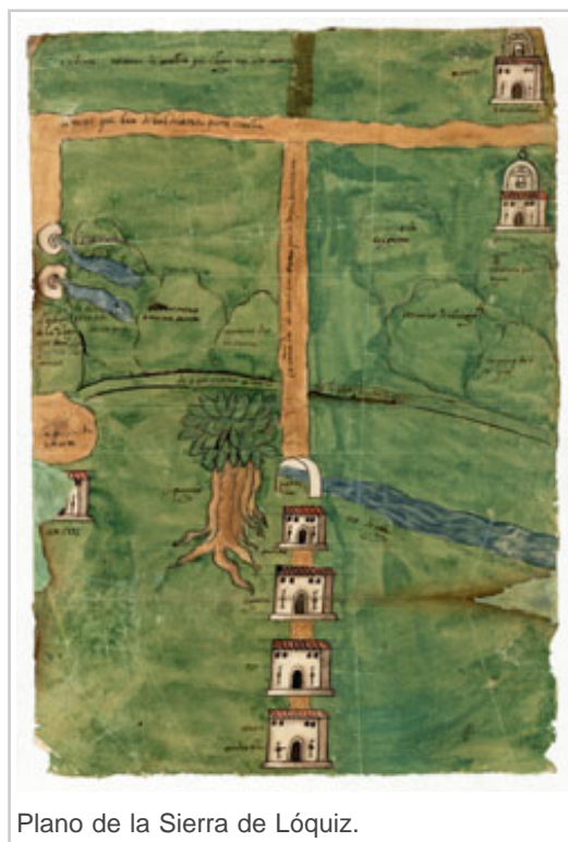
Plano de la Sierra de Lóquiz.

Todos los ejemplares que integran la colección de documentos figurativos del Archivo Real y General de Navarra han sido descritos, restaurados y digitalizados para ponerlos a disposición de los ciudadanos. Su publicación en el buscador web Archivo Abierto www.archivoabierto.navarra.es permite la consulta directa de las descripciones así como la visualización de todas las imágenes y su descarga, con el objetivo de acercar los fondos documentales del Archivo a todos los interesados.