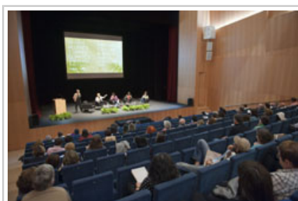
Público asistente al encuentro.