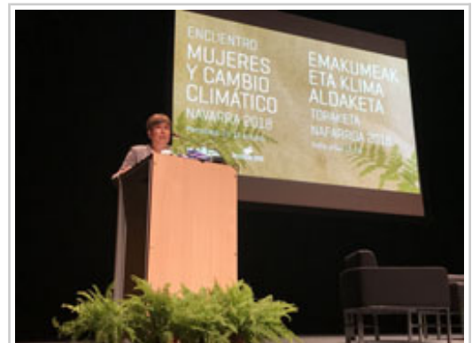
Un momento de la intervención de la Presidenta.

Uxue Barkos ha asegurado que no hay duda ya de que el cambio climático es una “realidad” y ha recordado que los expertos de Naciones Unidas urgen a adoptar “medidas rápidas y de gran calado” para evitar que el calentamiento global alcance 1,5 grados, algo que, al ritmo actual, podría llegar a partir del año 2030. “Sabemos que cualquier incremento en el calentamiento global afecta a la salud de los seres humanos, a la extinción de las especies y a la subida de los mares. Atajar ese calentamiento lograría reducir en cientos de millones de personas las poblaciones susceptibles de padecer los riesgos del cambio climático y la pobreza”, ha subrayado.