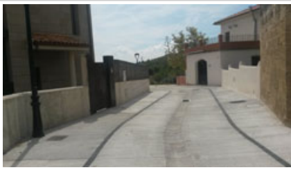
Vista de las obras realizadas.