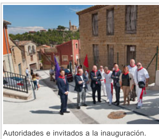
Autoridades e invitados a la inauguración.