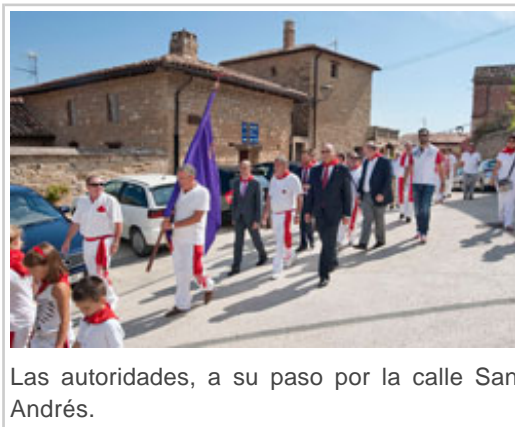
Las autoridades, a su paso por la calle San Andrés.

En cuanto al pavimento , se ha colocado losa de hormigón, con encintados laterales y caz central de hormigón prefabricado. Además, se han renovado los muros de contención existentes, ejecutando varios muros de hormigón armado revestidos de piedra de tipo arenisca. Las aguas pluviales han sido conducidas hasta el río Linares mediante colectores de PVC y hormigón. También se han ejecutado las canalizaciones correspondientes a baja tensión, alumbrado público y telecomunicaciones. La superficie pavimentada es de 1.717 m 2 .