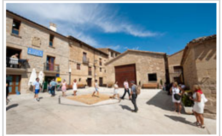
La Plaza de Valeriano Ordóñez.