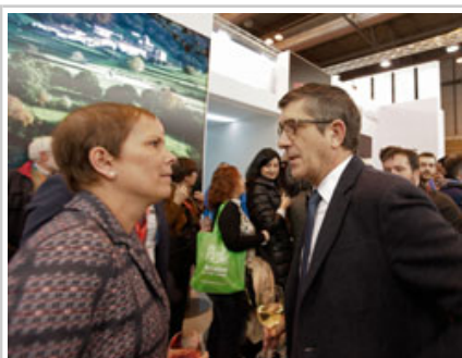
Uxue Barkos eta Patxi Lopez, Kongresuko presidentek Nafarroako stand-era egindako bisitaren une batean.