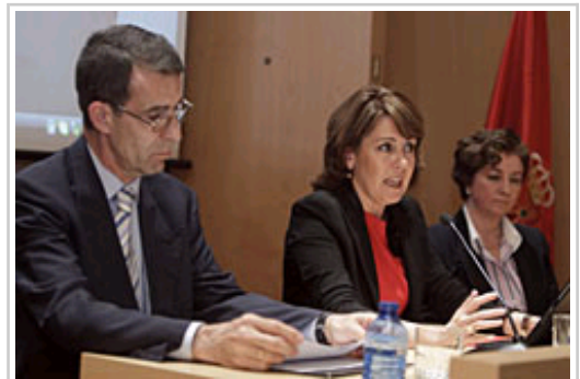
La Presidenta Barcina, flanqueada por Floristán (izda) y Galán (dcha).

La publicación se integra en una colección de diez volúmenes editados por el Gobierno de Navarra en colaboración con la Universidad de Navarra, Diario de Navarra y Caja Navarra-Banca Cívica sobre los centenarios que se conmemoran este año: el octavo centenario de la batalla de las Navas de Tolosa (1212) y el quinto de la conquista de Navarra (1512) y su posterior incorporación a la monarquía hispánica.