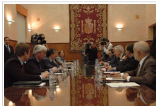
Aistentes a la reunión celebrada en la Delegación del Gobierno central en Zaragoza.

El Gobierno de Navarra exigirá que el Estado cumpla los compromisos que ha asumido en la reunión celebrada esta tarde en Zaragoza para evitar que en el futuro se produzcan nuevos desbordamientos e inundaciones como las que vienen sucediéndose durante los últimos años, y se mantendrá vigilante para conseguir que se lleven a la práctica las medidas anunciadas.