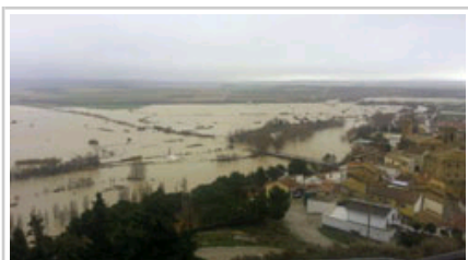
La localidad de Miranda de Arga, esta mañana.