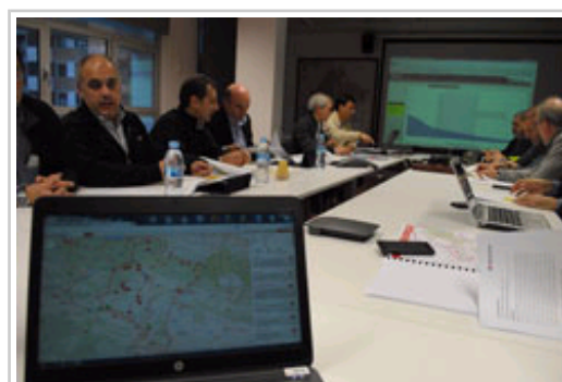
Imagen de la reunión celebrada en la sede de la ANE.

En la reunión también se han analizado las afecciones producidas por las crecidas de los ríos navarros , que hasta el momento han sido mínimas limitándose a desbordamientos en los lugares inundables. En este sentido se ha destacado el adecuado funcionamiento de los protocolos preventivos en el área de Pamplona y poblaciones limítrofes, que han evitado que se produjeran daños en bienes materiales. Asimismo se ha valorado positivamente el hecho de que apenas han tenido que intervenir los servicios de socorro y asistencia y la ausencia de incidencias graves .