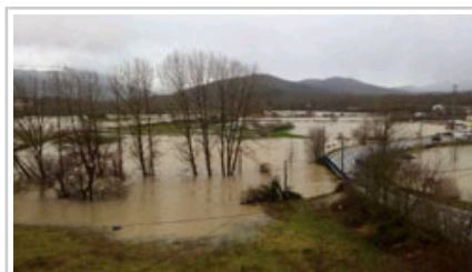
El río Arakil desbordado a la altura de Etxarri-Aranaz.